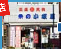
祭の小塚屋 明治38年創業 お祭り用品