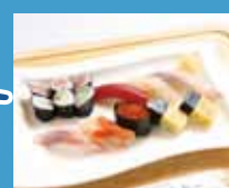
さつまや本店 和食寿司店 巻物の実演と昼食

主催：ふじさわ宿商店会・一般社団法人藤沢市商店会連合会・公益社団法人商連かながわ