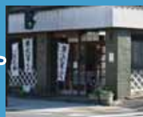
豊島屋本店 嘉永2年創業 和菓子の試食