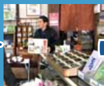
みつはし園茶舗 明治43年創業 お茶のおもてなし