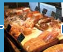
関次商店パンの蔵 風土 明治時代の蔵を改装 天然酵母のパン