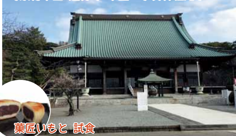
時宗総本山 遊行寺 本堂・宇賀神社見学