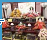
福田屋 明治20年創業 節句人形など