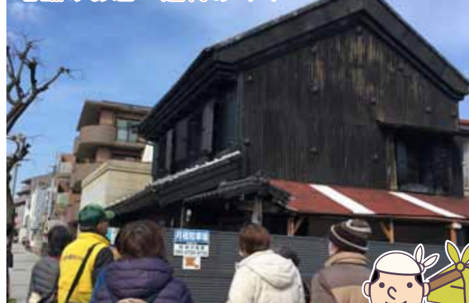
老舗のお店・建物めぐり